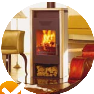
✓ POKOJOVÁ KAMNA